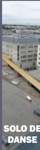
FILM Le crépuscule