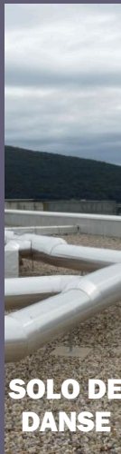
FILM Le jour