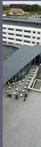
FILM La nuit